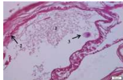
Gambar 3. Contoh gambar, nekrosis pada telson lobster: (1) tulang, (2) nekrosis, dan (3) parasit (HE. 200x)