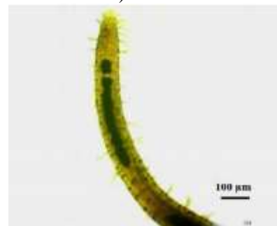
Gambar 2. Contoh gambar organisme, nematoda pada eksoskeleton lobster dewasa